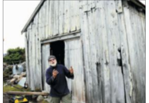
Restaurerer: Torskegarnnaustet fra midten på 1700-tallet er en utfordring.